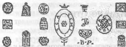
Рисунок 2 - Виды средневекового клейма

распоряжением в 1266 г. торговым знаком считается клеймо хлебопек, ставивших его на свою продукцию.